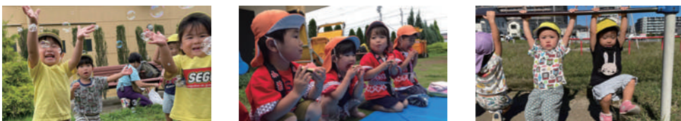
7月 夏のあそび 七夕 8月 夏まつり 夏まつりあそび ねっこうんどうかい 9月 運動あそび ○夏まつり(2歳児)