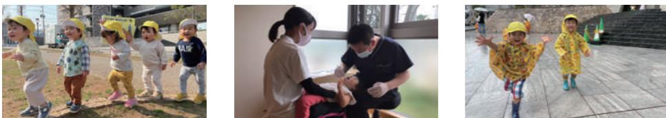
4月 楽しい保育園 入園・進級 5月 ルールがわかる 歯科検診 内科健診 6月 梅雨のあそび

●毎月のテーマと年間イベントスケジュール予定 ○印は全家庭保護者参加の行事です ○印は希望の方のみ参加する行事です