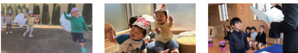
1月 お正月・冬のあそび 鏡開き 2月 成長の喜び 豆まき ねっこうんどうかい 3月 新年度への期待 ○卒園式 2歳児 修了式 1歳児、0歳児