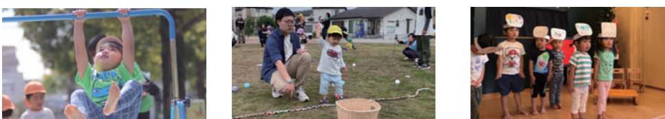
10月 運動会 園見学会 内科健診 運動会あそび 11月 実りの秋 ○親子レクリエーション 歯科検診 ○運動会(2歳児) 12月 クリスマスともちつき クリスマス会