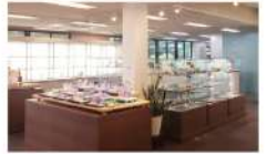
直営店ではイニシャル加工も対応

創業90年を迎える日本初のクリスタル専門メーカー。機械に頼らず、工場内で職人が一つ一つ想いを込めて作りあげる作品との出会いは、まさに一期一会。直営店には、グラスはもちろん、花瓶など様々な品物が並ぶ。ここでしか手に入らない貴重な作品との出会いも、直営店ならではの。人生の節目を、お気に入りのクリスタル製品で彩りませんか？ Open 9:00~17:00 定休日 日曜日・祝日・夏季・年末年始 住所 龍ヶ崎市向陽台4丁目5番地 https://www.kagami.jp/shop/headoffice.html