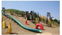
巨大遊具は子どもたちに大人気！