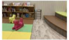
キッズスペースは親子で寛ぐことができる

市内にあるサブラスクエアサブラ内に併設されている、たつのこ図書館。館内には約2,000冊の本が並び、コーヒーを飲みながらゆったり読書ができる。キッズスペースや、テレワークスペースも完備されており、お買い物ついでに気軽に足を運ぶことができるのも魅力。 Open 10:00~20:00 定休日 ホームページ参照 住所 龍ヶ崎小柴5丁目1番2 サブラスクエア サブラ2階 https://tosyo.city.ryugasakiibaraki.jp/bunkan/bunkan.html