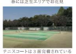
春には芝生エリアでお花見 テニスコートは3面完備されている