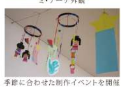
ミ・ナーデ外観 季節に合わせた制作イベントを開催