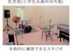
乳児室(小学生未満利用可能) 本格的に練習できるスタジオ