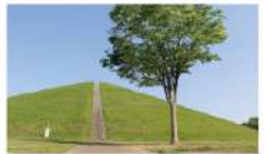
シンボルの「たつのこやま」

シンボリック存在の「たつのこやま」の他に、野外ステージ、巨大遊具があり、休日には多くの家族連れで賑わう。広大な芝生のエリアにテントを張って、ピクニック気分を味わうことができるのも魅力。月に1度、たつのこやま隣でマルシェも開催され、多くの家族連れで賑わう。近隣には商業施設もあり、子供と全力で遊んだついでに買い物も。家族で満喫できる龍ヶ崎のおススメスポット。 住所 龍ヶ崎市中里3-1 https://www.city.ryugasakiibaraki.jp/kanko/filmcommission/locationlibrary/park/2013091800273.html