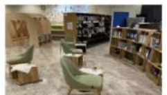
みんなが寛げる工夫がたくさん